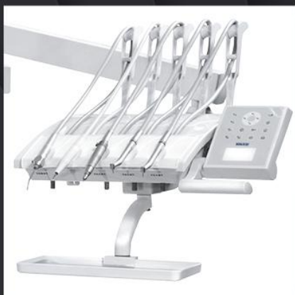
Верхняя подача инструментов