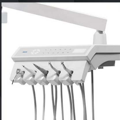
Нижняя подача инструментов

Все пантографические плечи установки сделаны из металла и покрыты эпоксидной порошковой краской, что гарантирует долговечность работы.